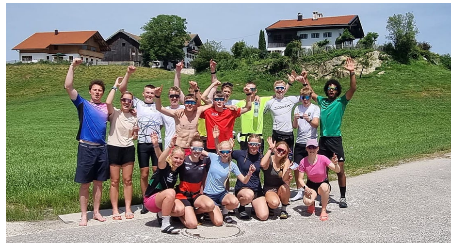
Gemeinsames Training CJD mit Skilangläufern der norwegischen Schule Sirdal VGS.