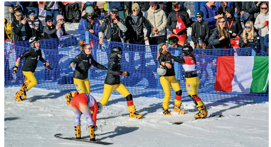
Team-Siegerjubiläum im Ziel.