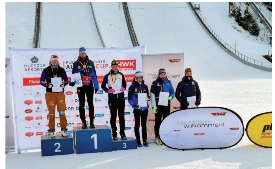
DP-Sprint-Wettkampf in Seefeld Huber Platz 5

Bei all diesen Wettbewerben der vergangenen Saison feierten die Athletinnen und Athleten der Gaumannschaft beeindruckende Erfolge. Diese großartigen Leistungen