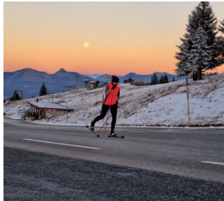
Skirollertraining CJD am Rossfeld.

sind vor allem dem unermüdlichen Engagement der Sportlerinnen und Sportler im Training als auch im Wettkampf zu verdanken, gepaart mit einem respektvollen und unterstützenden Umgang miteinander.