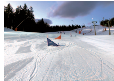
Stützpunkttraining am Göttschen.