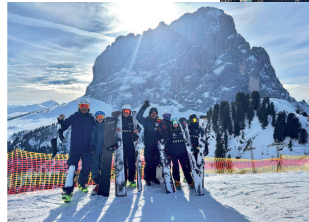
Snowboard-Team beim Weltcup in Gröden.