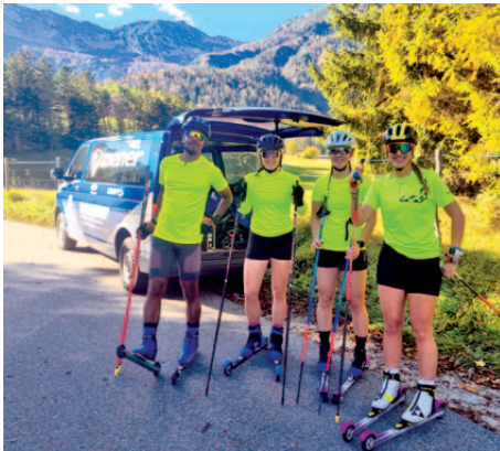
Skirollertraining CJD in Berchtesgaden.