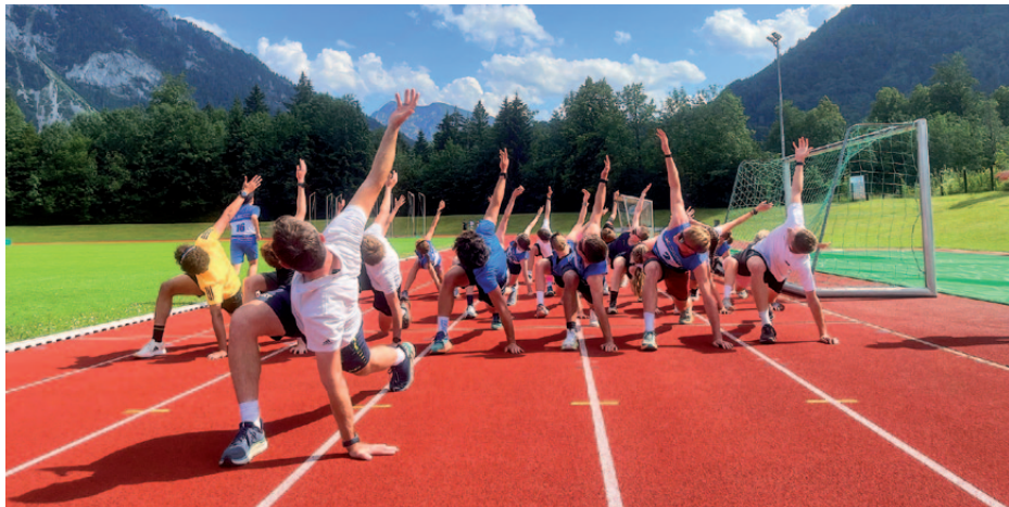
Sommertraining in der Chiemgau Arena. Immer wieder werden auch im Ruhpolder Waldstadion Einheiten absolviert.