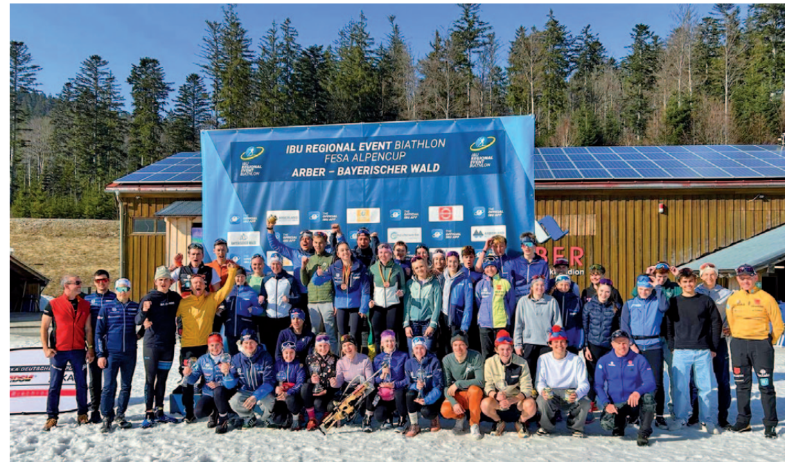
Das ganze Jugendteam mit Betreuern nach dem DP-Finale am Arber.