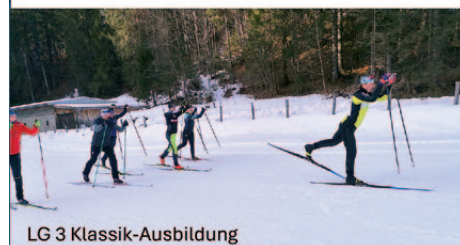
LG 3 Klassik-Ausbildung