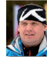
KR Biathlon Hermann Feil SC Ruhpolding