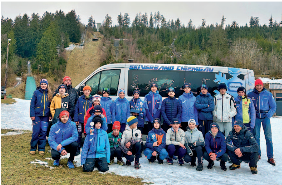
Team Reg 3 BSC Bischofsgrün.

In Sachen Nachwuchssichtung war wieder die Zusammenarbeit mit den Grundschulen Ruhpolding, Berchtesgaden, Bischofswiesen, Schönau am Königssee, Oberau, Marktschellenberg und Ramsau möglich. An 4 Schultagen wurden gesamt 130 Kinder auf kleinen Anfängerschanzen gesichtet, daraus fanden sich ca. 30 im Vereins-Anschlussstraining wieder. Der „Grundschultag-Skispringen“ ist fest mit dem Kultusministerium Bayern verankert und unser wertvollster Nachwuchstag im Chiemgau.