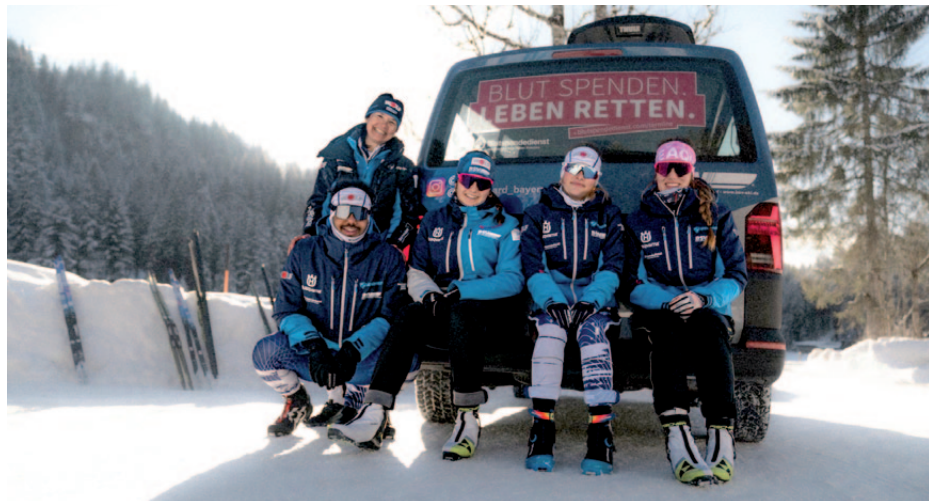
Trainingsgemeinschaft CJD (ohne Eckel).

Neben diesem regulär stattfindenden Training konnten durch verschiedene Lehrgangmaßnahmen nicht nur inhaltliche Höhepunkte gesetzt, sondern auch ein gutes Miteinander erreicht werden. Bereits im Juni fuhren 26 Sportlerinnen und Sportler zum DSV-/BSV-Camp nach Bischofsgrün, um dort mit Langläufern aus ganz Deutschland gemeinsam zu trainieren. Dort standen vor allem Inhalte aus dem Bereich der