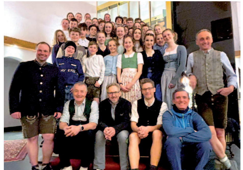
Schüler-Team Bayern beim Drei-Ländervergleich in Seefeld.

Die meisten Trainingstage wurden in der Chiemgau Arena absolviert. Die BSV-Kader SportlerInnen durften zu Trainingslehrgängen des BSV fahren. Die Jug I hatte einen Lehrgang am Arber, die Jug II einen Lehrgang in BGD, sowie einen Schneelehrgang in Obertilliach. Zusätzlich standen für die NK II Athletinnen Trainingslehrgänge in Leipzig, Ruhpolding, Oberhof und Martell auf dem Plan.