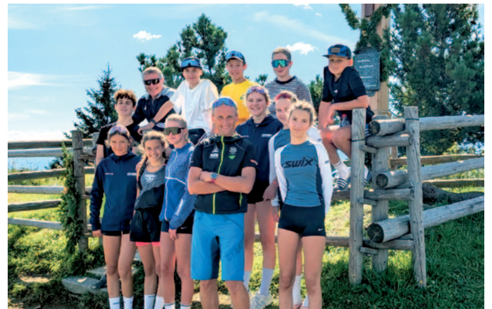
Schüler-Trainingslager in Berchtesgaden.

Es folgten starke Auftritte bei der Oberbayerischen Meisterschaft im Sommerbiathlon in Burgrain sowie bei der Bayerischen Meisterschaft in Ruhpolding. Auch beim SLK-Saisonauftakt in Nesselwang im Juli präsentierten sich die jungen Athletinnen und Athleten in guter Form. Ein wichtiger Baustein der Saisonvorbereitung war zudem das gemeinsame Trainingslager mit dem Schülerteam BGD in Berchtesgaden im August. Mit dem Sommer-BSC und dem Sommer-DSC in Neubau setzte die Schülergruppe ihre Erfolgsserie fort. Ab Ende November wurde dann in der Chiemgau Arena auf Schnee trainiert und damit die Grundlage für einen erfolgreichen Winter gelegt. Es folgten der Winter-BSC vor Weihnachten, der BSC sowie die Bayerische Meisterschaft am Arber Anfang Januar und schließlich das BSC-Finale Mitte März in Ruhpolding.