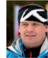
KR Biathlon Hermann Feil SC Ruhpolding