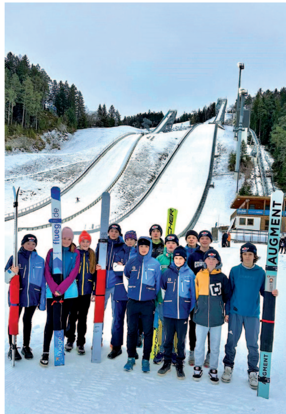
Training in Seefeld.