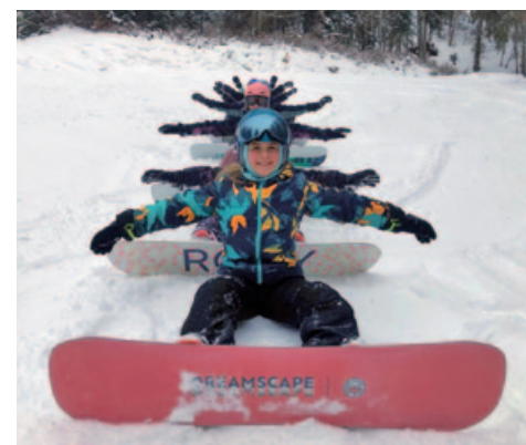
Stützpunkt-Boarder beim Training.