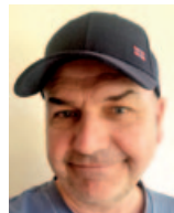
Biathlon Mik Broschart SC Ruhpolding